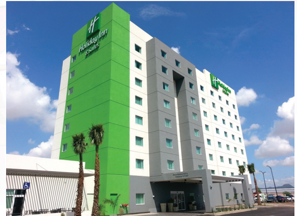
Hotel Holiday Inn

Aislaterm Placa , es un sistema de revestimiento ligero que proporciona aislamiento térmico con acabado arquitectónico. Este sistema, puede incorporar una placa de: EPS (Poliestireno Expandido convencional), BLUEBOARD® (Placa de alta densidad) o GREENBOARD® (Poliestireno Expandido de mejor anclaje). El aislamiento es adherido al exterior o bien interior del muro y recubiertas con dos capas de Base Coat reforzado con Malla Fibra de Vidrio.