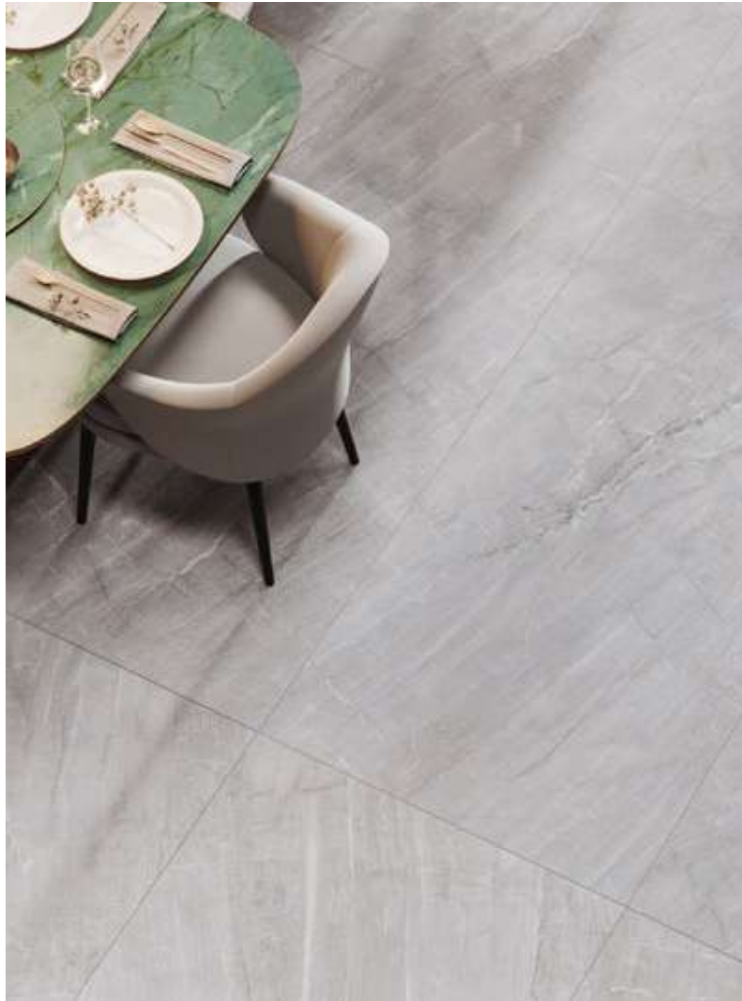
Piso Taj Mahal 90x180 cm