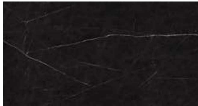
Cosmic Black 90x180 cm