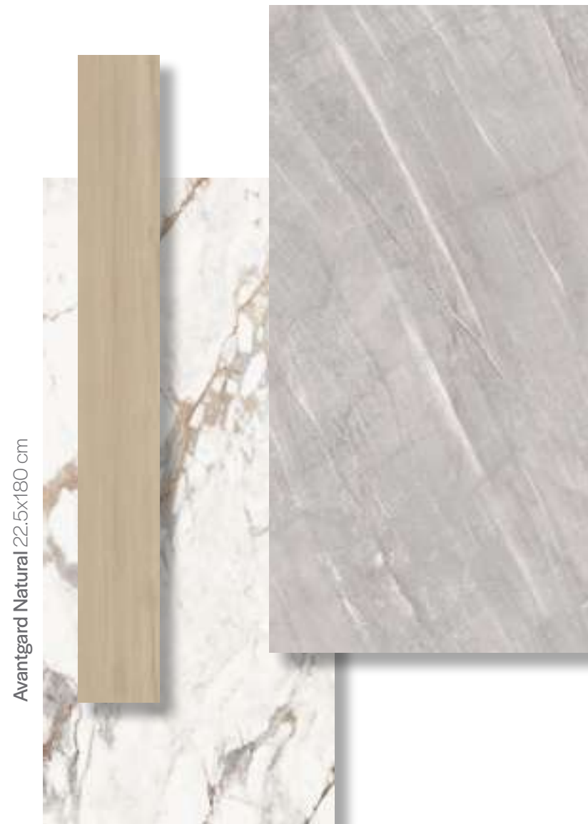
Avantgard Natural 22.5x180 cm