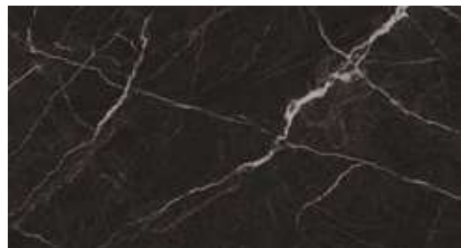
Saint Laurent 90x180 cm Semipulido*