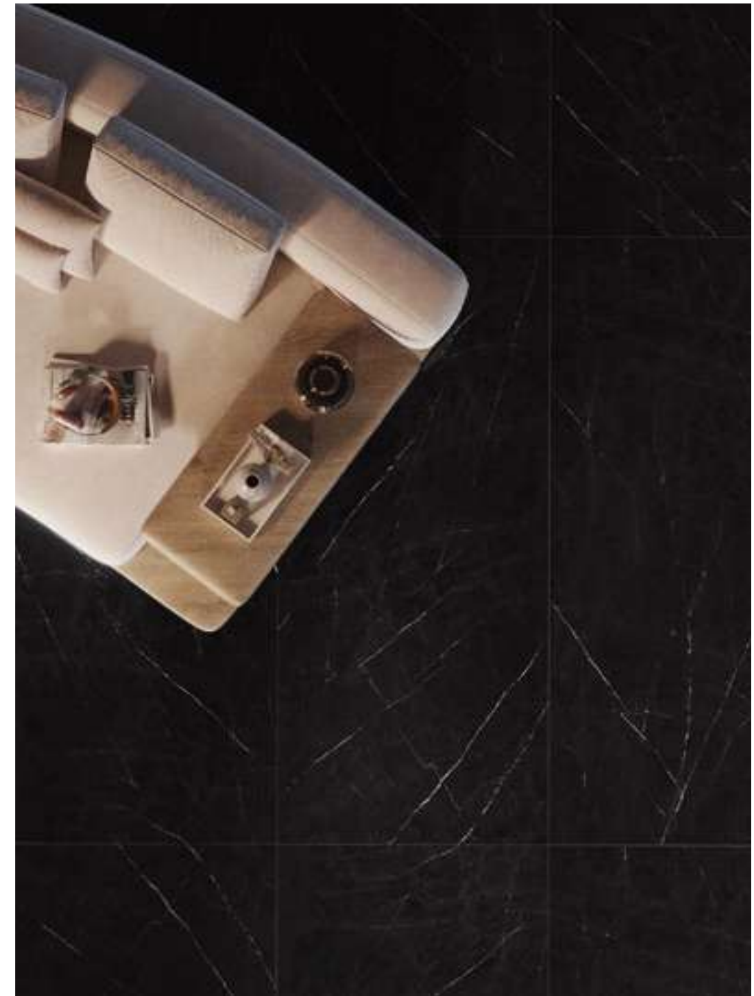
Piso Cosmic Black 90x180 cm

Cosmic Black, presenta un fondo negro profundo y pulido que crea una sensación de misterio y sofisticación en cualquier espacio. Las delicadas vetas blancas que atraviesan la superficie añaden un toque de luminosidad y drama, creando un contraste impresionante.