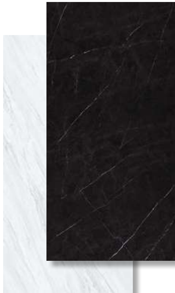
Marble Slab Palissandro 90x180 cm