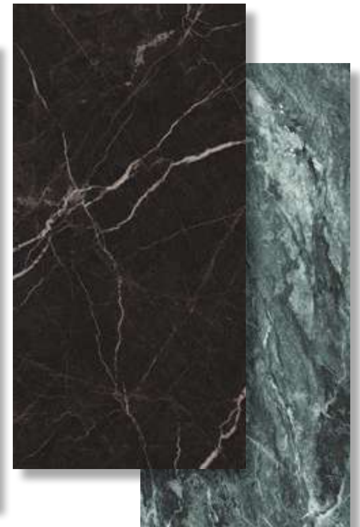
Lux Marble Green Alpi 80x180 cm