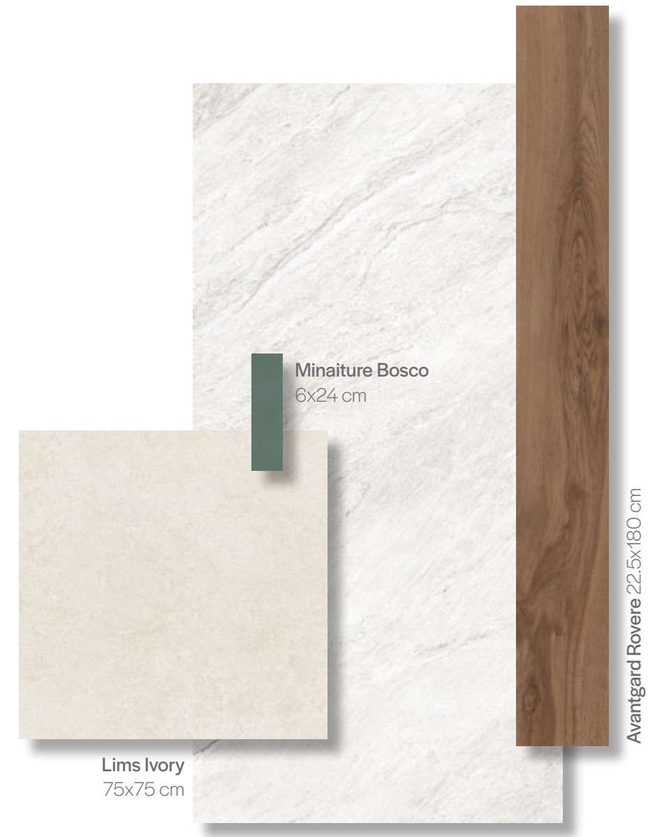
Miniture Bosco 6x24 cm