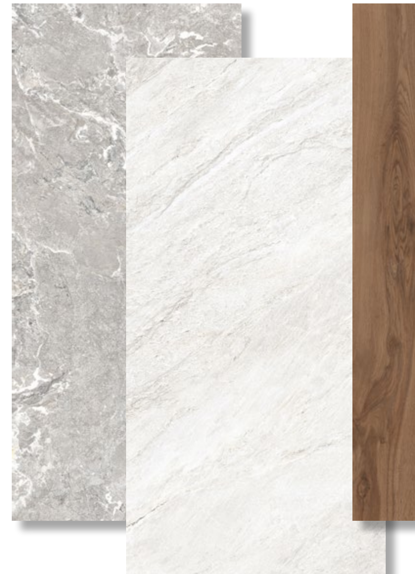
Onyx&More White Porphyry 80x180 cm