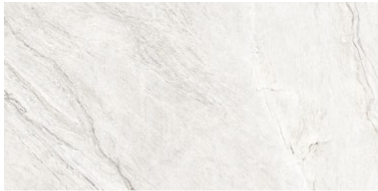
White 90x180 cm