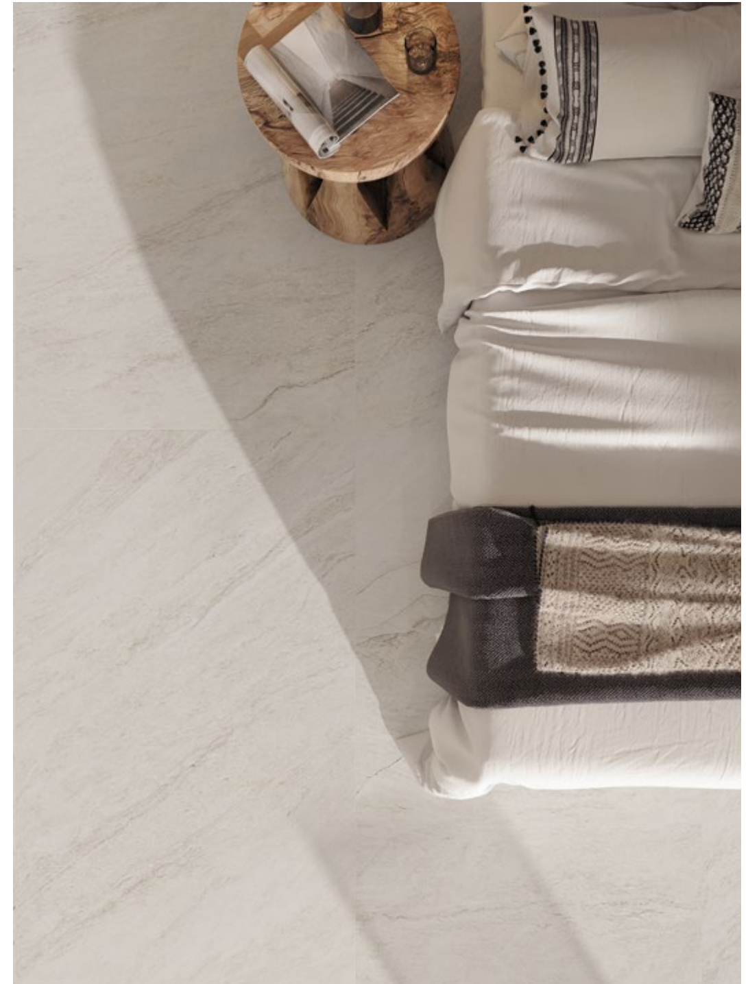
Piso Vibes Stone White 90x180 cm