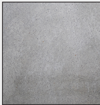
Gris Cálido KQ-42