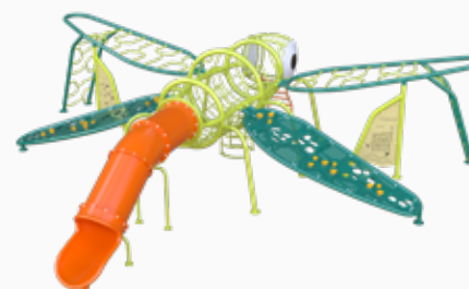
Vista perspectiva posterior